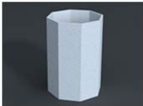
IMAGEN DE PRODUCTO / SPALT 03