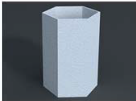
IMAGEN DE PRODUCTO / SPALT 02