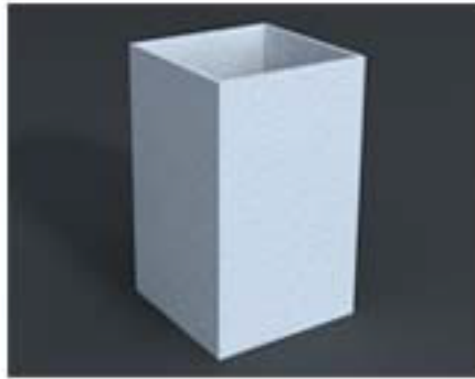
IMAGEN DE PRODUCTO / SPALT 01