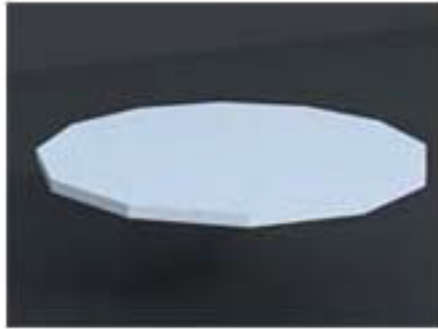
IMAGEN DE PRODUCTO / NURBS 02