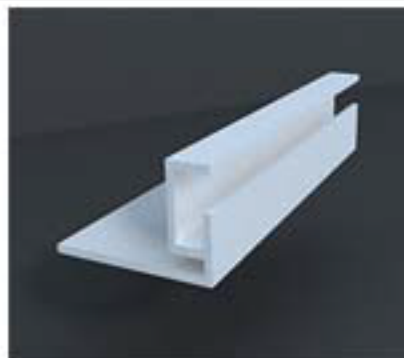
IMAGEN DE PRODUCTO / BAND 03